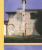
Chiesa di San Giovanni Church of Saint John Église de Saint Jean Kirche Heilige Johannes