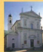
Chiesa Parrocchiale dei Santi Pietro e Paolo St. Peter's and St. Paul's parish Church Église Paroissiale dédiée aux Saints Pierre et Paul Pfarrkirche Sankt Peter und Paul