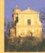
Chiesa di San Martino Church of San Martino Église de Saint Martin Kirche San Martino