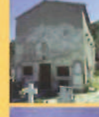
Oratorio di San Gregorio Oratory of San Gregorio Oratoire de Saint Grégoire Oratorium von San Gregorio