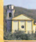
Chiesa di San Marco Church of San Marco Église de Saint Marco Kirche San Marco