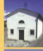
Oratorio di Sant'Antonio di Padova Oratory of Sant'Antonio di Padova Oratoire de Saint Antoine de Padoue Kapelle Sant'Antonio di Padova