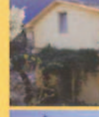
Oratorio dei Santi Faustino e Giovita Oratory of St. Faustino and St. Giovita Oratoire des Saints Faustino e Giovita Oratorium der Heiligen Faustino und Giovita