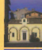
Oratorio della SS. Trinità Santissima Trinità Oratory Oratoire de la Santissima Trinità Oratorium der Allerheiligsten- Dreifaltigkeit