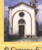
Oratorio dei Santi Siro e Libera Oratory of Saints Siro and Libera Oratoire des Saints Siro et Libera Oratorium der Heiligen Siro und Libera